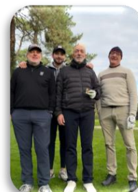
Gagnants en brut